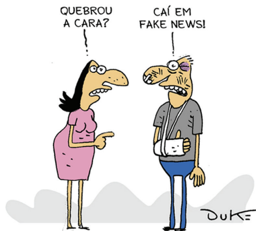
Figura 1: Charge sobre o perigo de cair em fake news