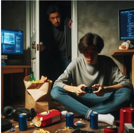
Figura 4: O tempo excessivo na internet pode impactar o desempenho escolar, as relações pessoais e a saúde física e mental