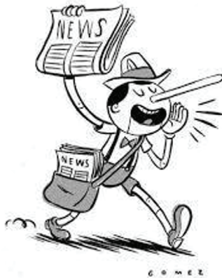
Figura 2: Charge sobre mentiras e fake news

Na Figura 2, a charge sobre mentiras e fake news destaca a relevância de saber identificar uma notícia verdadeira. Mesmo sendo publicada em um jornal, é fundamental reconhecer se a fonte e as informações contidas são confiáveis.