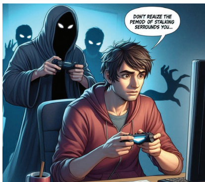
Figura 6: Tradução no balão: Não perceba que o stalking está ao seu redor