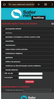
Plataforma digital de Denúncia do SaferNet