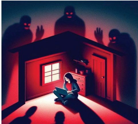
Figura 5: As sombras da internet: o que vocês não veem podem machucar seus estudantes e filhos