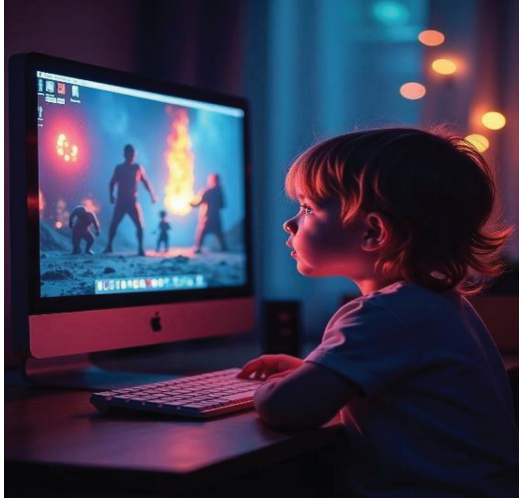
Figura 3: O contraste entre a inocência da infância e a exposição