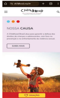
Plataforma digital Childhood Brasil